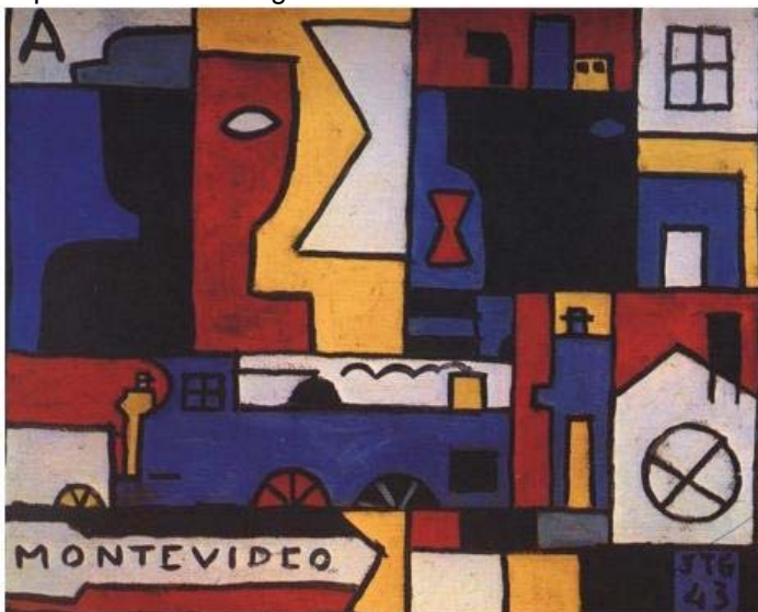
Joaquín Torres García, " Constructivo de cinco colores con locomotora azul ", 1943

http://www.comechingonia.com/Virtual%203/Arte%20Antropologia%20Lucero%202007.htm