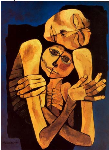
Guayasamín - Ternura - 1989

Guayasamín. http://www.guayasamin.com/pages/index.html